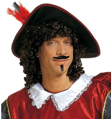
Un capé sous Capet et peut-être soussestaffé.